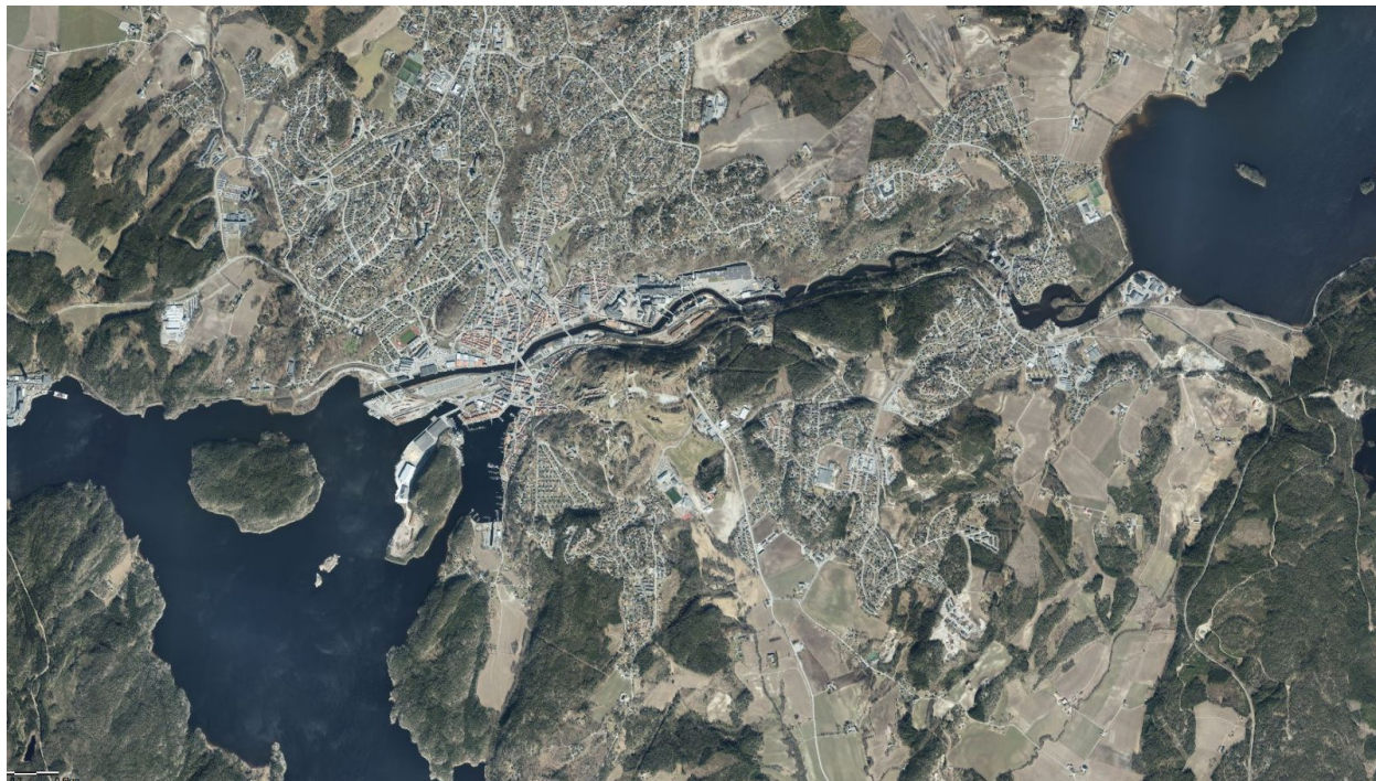
Fig. 1: Feltet fra 12.000 fot

Feltet Fredriksten festning i Halden kommune befinner seg umiddelbart øst for Halden by og 34 km sør for Rakkestad flyplass. Primært landingsområde er velegnet, men nærhet til Halden by gjør alternativer krevende.