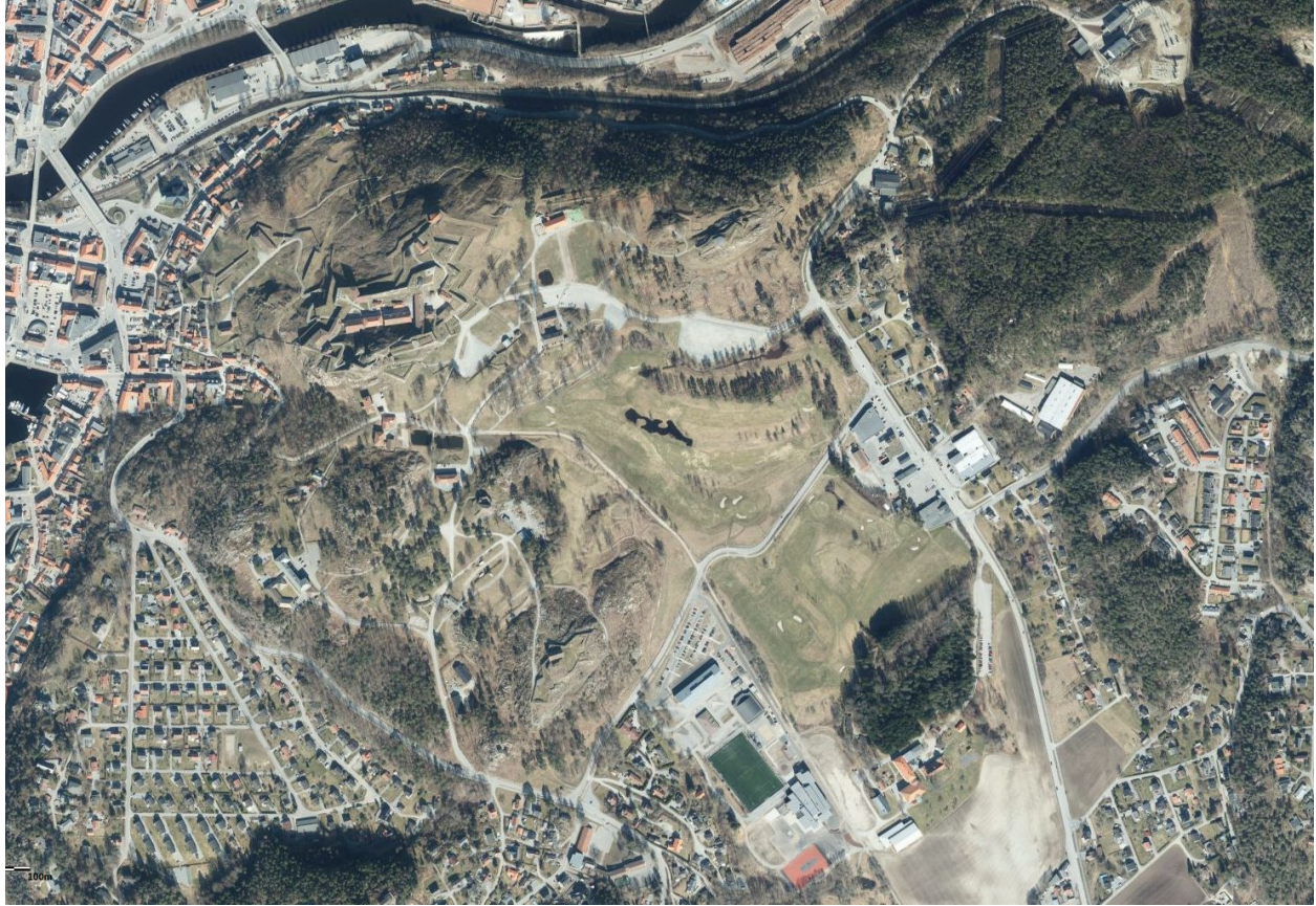
Fig. 2: Hoppfeltet fra ca. 8.000 fot.

// Informasjon om hoppfeltets beskaffenhet, fareområder, alternativer, etc etc.